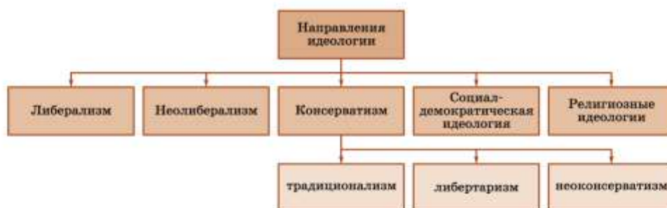
Схема 19. Направления идеологии

Либерализм — это идейно-политическое течение, где на первое место выдвигается идея свободы, понимаемая прежде всего как свобода частного предпринимательства, свобода личности, защита прав и свободы человека, недопущение вмешательства государства в экономику, право угнетенных на восстание против своих угнетателей. У истоков этого течения стояли Дж. Локк, Б. Спиноза, А. Смит, Ш. Монтескье, Ж. Ж. Руссо, И. Кант и др. Среди русских государственных и общественных деятелей наиболее известны М. М. Сперанский, А. И. Кошелев, П. И. Милюков и др.